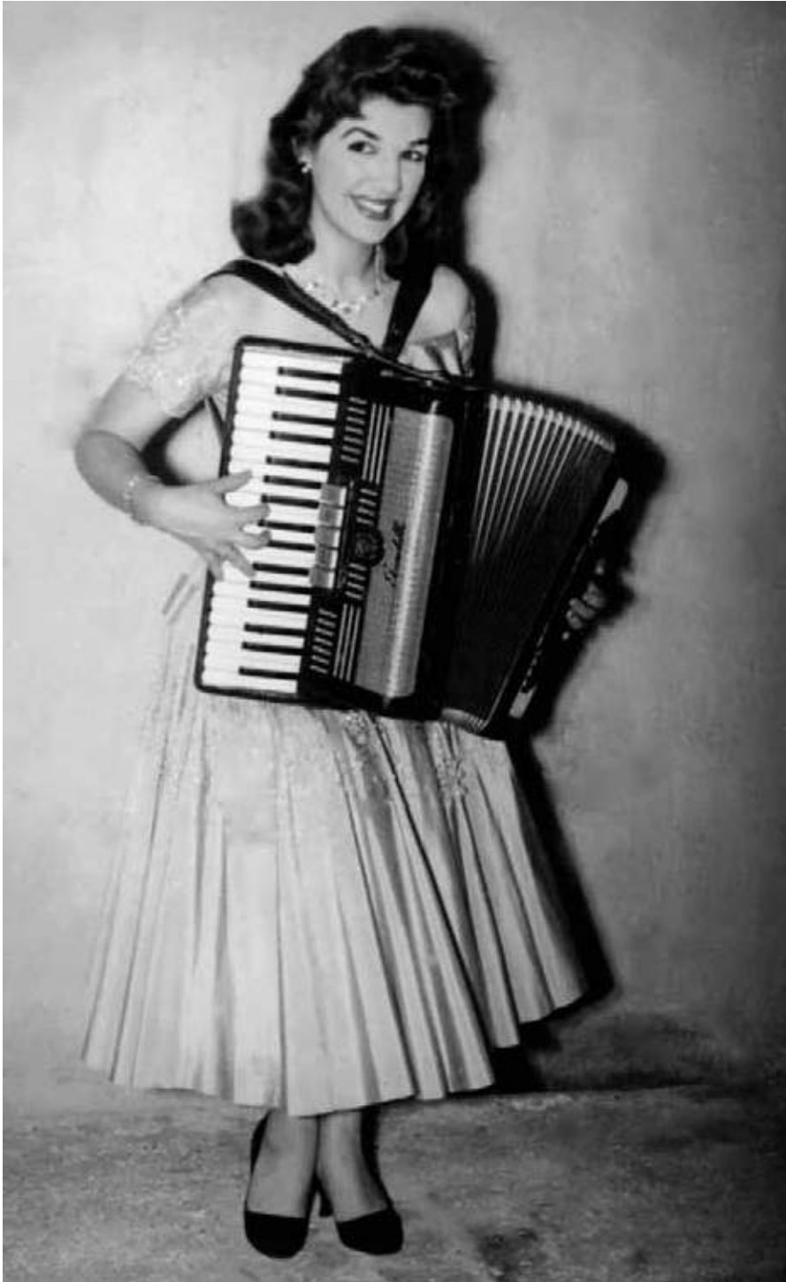
Adelaide Chiozzo do filme Sai de Baixo Adelaide e Ankito em cena do filme É fogo na roupa | 1952