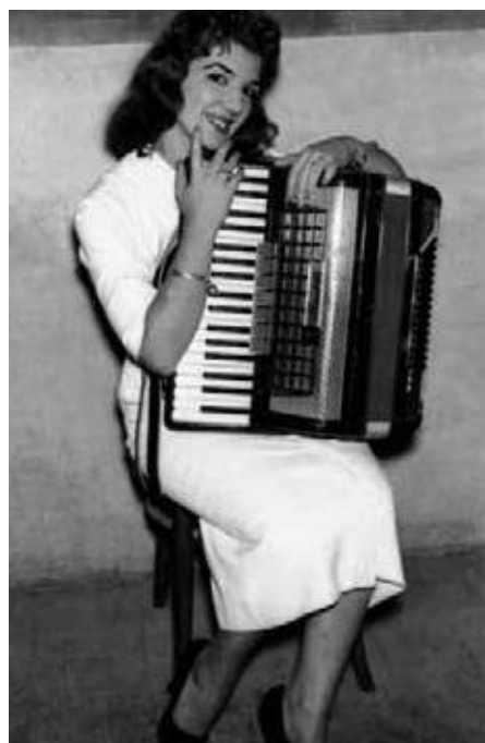
Homenagem em Resende – RJ | Quando recebeu o título de Mãe Radialista | 12 de maio de 1957