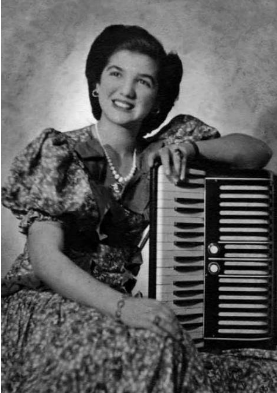
Com 13 anos | 1944