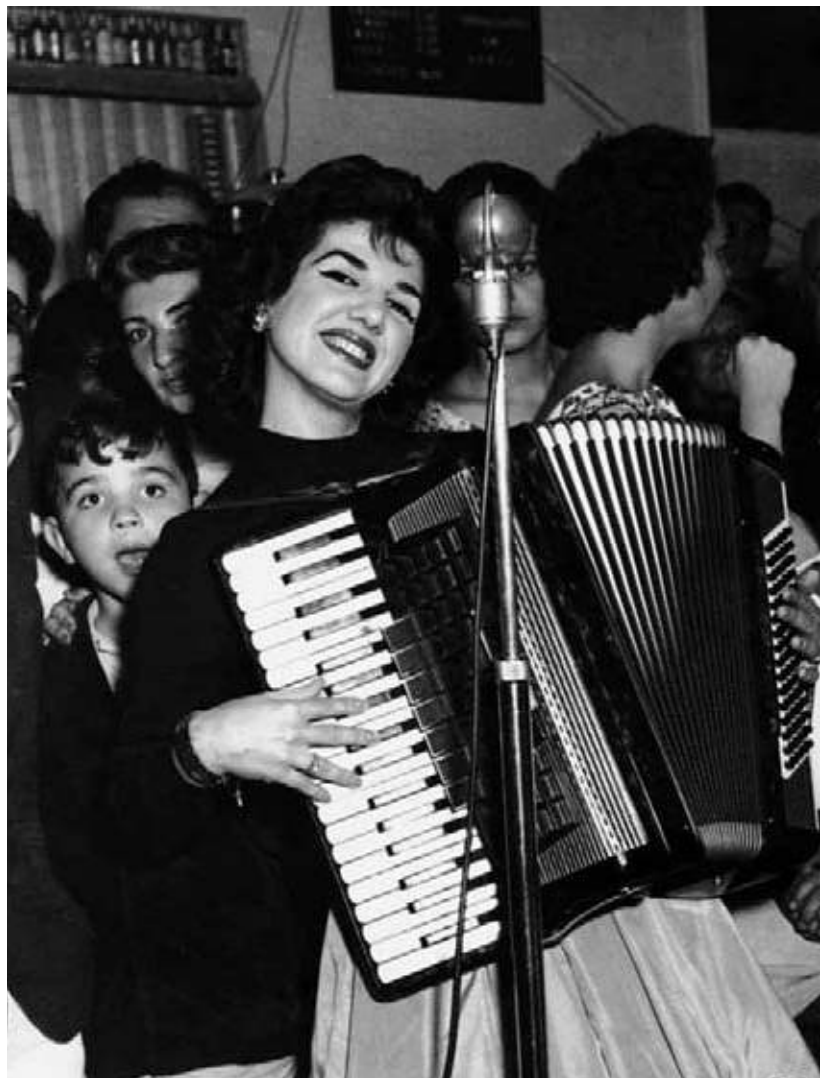
Caldas de Cipó, Bahia | 1952 1955