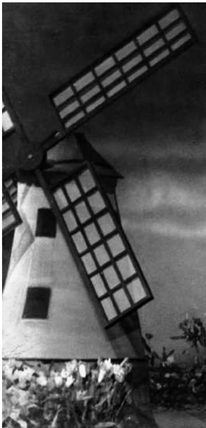
Adelaide vestida de holandesa no filme Carnaval no fogo | 1949