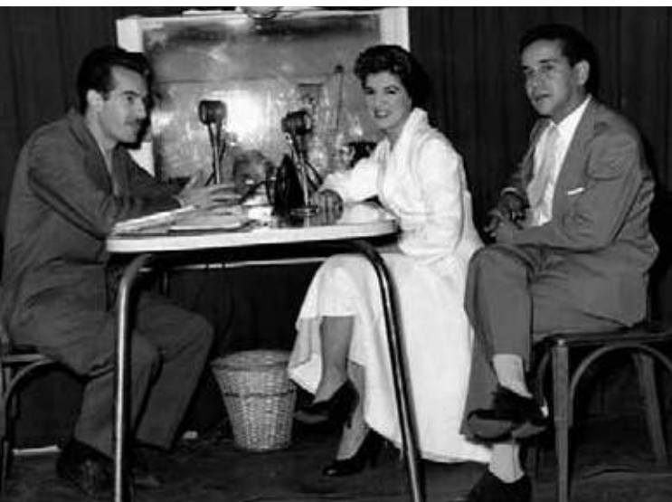
Governador Valadares, MG | 1953 Rádio Gaúcha – Porto Alegre, RS | 1952 Londrina | 1956 | Rádio local Botucatu | 1955