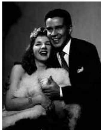
Fevereiro 1951 Casamento no civil | 20 de janeiro de 1951 1958