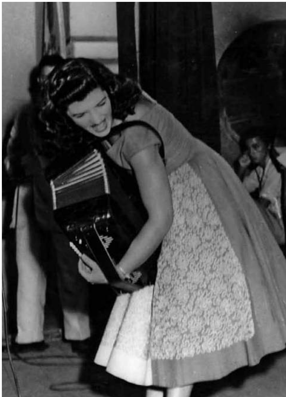
Itaperuna – RJ | 1952