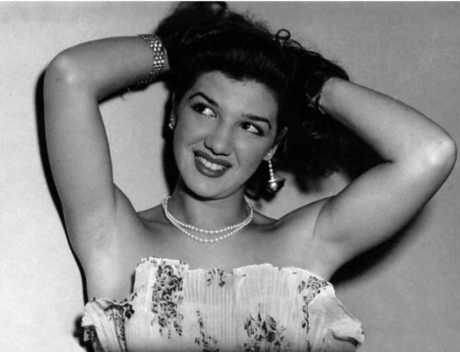
Caldas de Cipó, Bahia | 1952